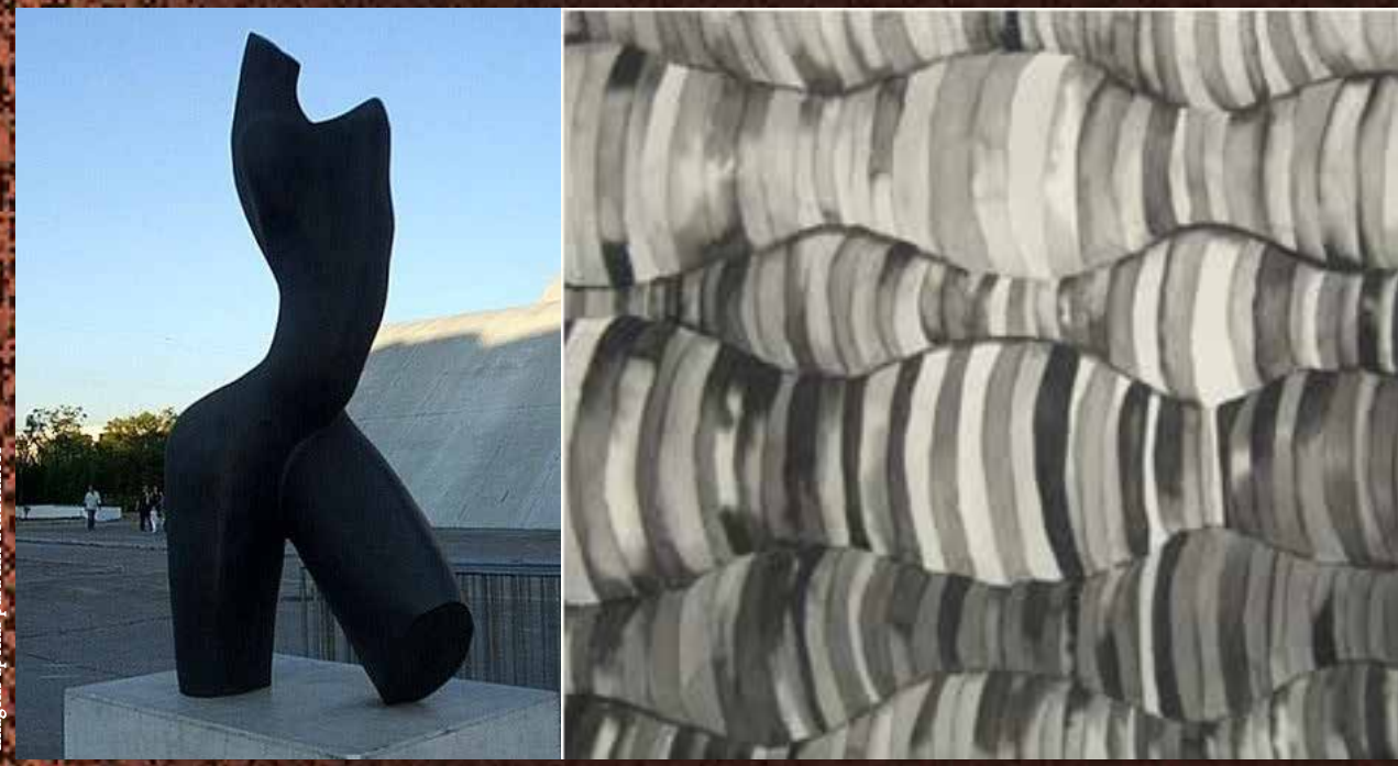
*Imagens apenas para fins acadêmicos